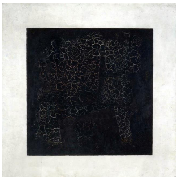
Казимир Малевич «Чёрный супрематический квадрат», 1915.

Начнем с того, что «Чёрный квадрат» вовсе не черный и совсем не квадратный: ни одна из сторон четырехугольника не параллельна ни одной другой его стороне, и ни одной из сторон квадратной рамки, которой обрамлена картина. А темный цвет – это результат смешения различных красок, среди которых не было чёрной. Считается, что это была не небрежность автора, а принципиальная позиция, стремление создать динамическую, подвижную форму.