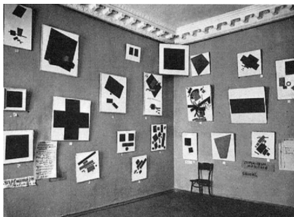
Выставка «0,10». Петербург. Декабрь 1915 .

сандр Бенуа писал: «Несомненно, это и есть та икона, которую господа футуристы ставят взамен мадонны».