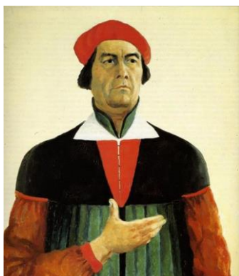
Автопортрет. Художник. 1933.

А максимально примитивному рисунку – квадрату – можно приписывать какой угодно глубокий смысл, простор для человеческой фантазии просто безграничен. Не понимая, в чём великий смысл «Чёрного квадрата», многим людям нужно его себе придумать, чтобы было чем восхищаться при рассмотривании картины.